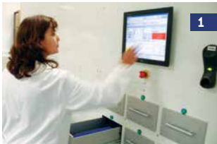
1 O HIS / ERP envia ordens via interface bidirecional. Um usuário autorizado inicia o sistema.