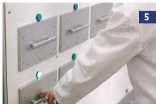
5 O sistema desbloqueia a gaveta dinâmica, acendendo a luz orientadora, para o usuário consequentemente abri-la.