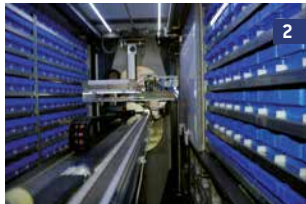
2 O braço robótico recupera o bin a partir da posição de armazenamento para uma gaveta dinâmica na estação de trabalho.