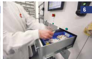
6 Enquanto o usuário faz a coleta, o robô continua preenchendo as restantes gavetas dinâmicas e guardando as caixas já finalizadas.