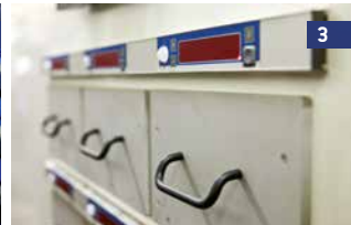
3 Estação de trabalho com um conjunto de gavetas dinâmicas bloqueadas.